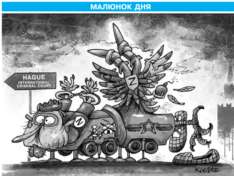
іЗкандер на шляху до Гааги.

«Путін може говорити все що завгодно, але є лише одна людина, відповідальна за цю незаконну, неспровоковану війну, і це — він, і він повинен зупинитися. Ось чому Велика Британія була непохитною в під-